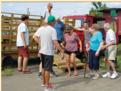
Photo 2016-08-01-3030 - "Memories" - a group of "older kids", exiting at the end of a ride on the Division's "Hay-Wagon".

La division du Nouveau-Brunswick a déterminé sa saison d'opération pour cette année. Elle s'étendra du samedi 24 juin au lundi 4 septembre 2017. À nouveau cette année, la division prévoit continuer à offrir l'entrée gratuite au musée le jour de la fête du Canada, le samedi 1er juillet et également à la fête du Nouveau-Brunswick, le lundi 7 août 2017, aidant à souligner le 150e anniversaire du Canada.