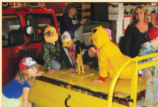
Photo 2016-08-29-1616 - "Intrigue of the Past" - A photo of several pre-school children figuring out what all the Motor Car Levers were for.

The N.B. Division has set its Operating Season for this year. It will be from Saturday, June 24, to Monday, September 4, 2017. Once again this year the Division is planning to continue its annual practice of Free Entrance to our Museum on Canada Day, Saturday, July 1, as well as New Brunswick Day, Monday, August 7, 2017, this year helping to mark Canada's 150th Birthday.