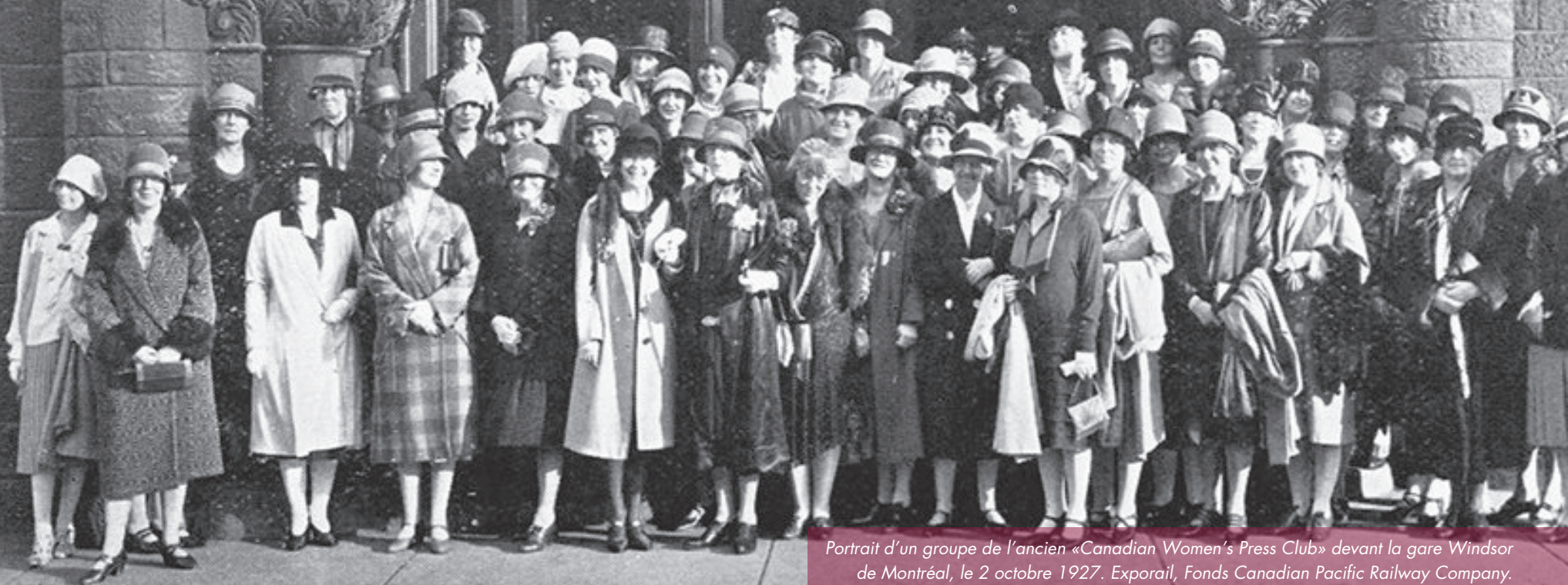
Portrait d'un groupe de l'ancien «Canadian Women's Press Club» devant la gare Windsor de Montréal, le 2 octobre 1927.