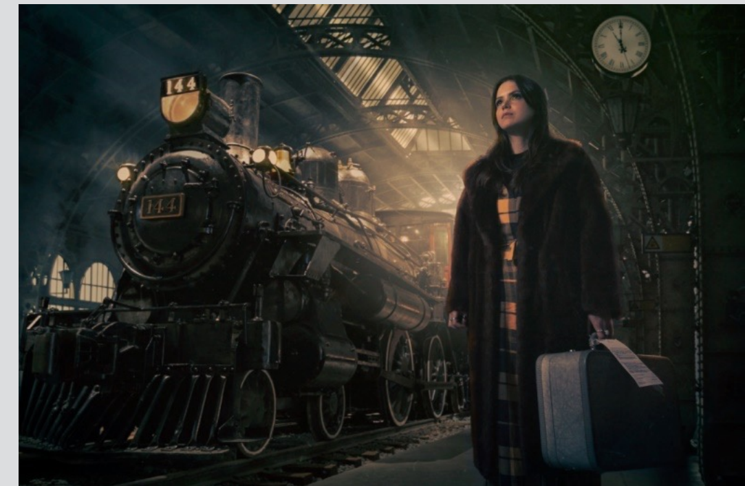
Séance de photographie de la chanteuse Stefanie Parnell pour le lancement de son nouveau single If I leave.

113 jours de locations d'espaces intérieurs et/ou extérieurs pour entreprises.