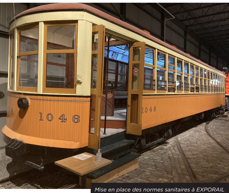
Mise en place des normes sanitaires à EXPORAIL