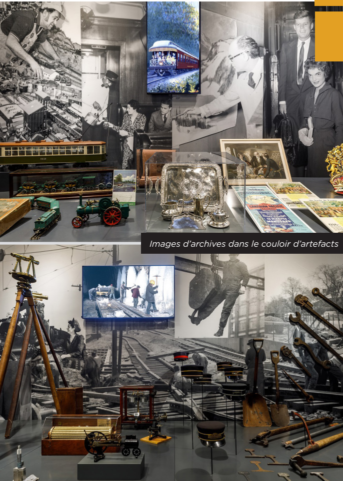
Images d'archives dans le couloir d'artefacts

Le Centre d'archives privées agréé et de documentation de l'ACHF a reçu durant l'exercice financier 2019-2020 un montant de 30 986,19$ octroyé par BAnQ pour son fonctionnement. Son agrément a également été renouvelé de nouveau pour une période de deux ans. La Fondation de l'ACHF a aussi apporté son soutien par le truchement de dons du CP dans le fonds de dotation N.R. Crump établi pour le soutien aux archives; puis, s'est ajoutée une subvention de BAnQ (Programme de soutien au traitement des archives) de 5 000$ pour le traitement d'une partie des documents portant sur l'histoire du Québec du Fonds Canadian Pacific Railway Company selon les Règles de description des documents d'archives.