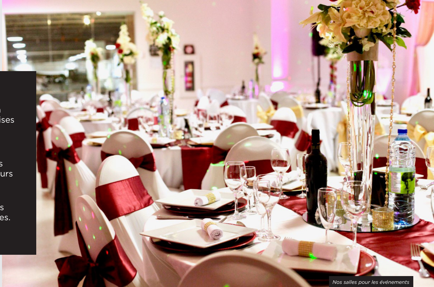
Nos salles pour les événements

2 longs métrages cinématographiques et 8 jours de séances photos commerciales.