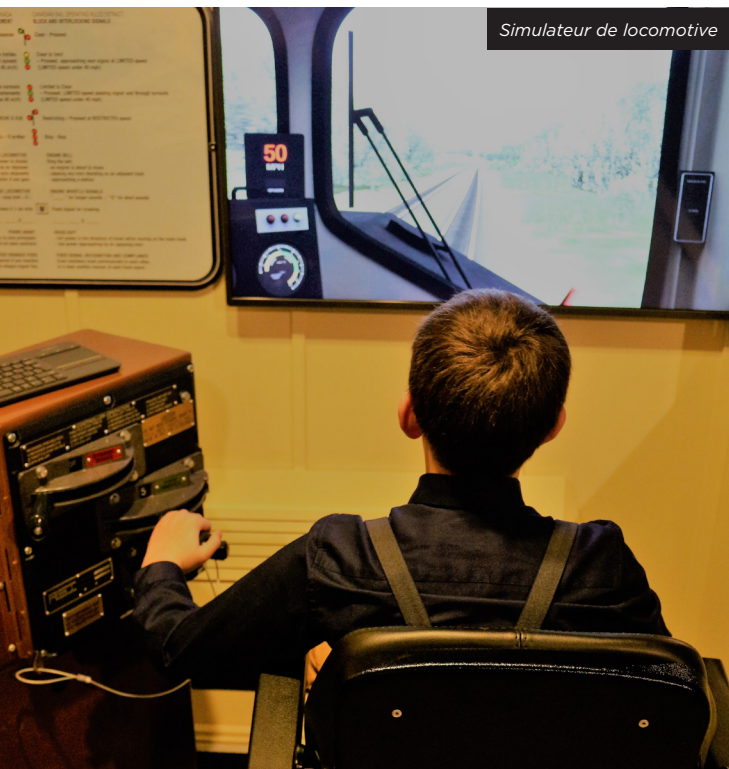
Simulateur de locomotive

Pour une seconde année, EXPORAIL a procédé à une enquête sur sa clientèle estivale en collaboration avec la Société des musées québécois afin de sonder le type de provenance de ses visiteurs ainsi que leur satisfaction. La compagnie Rail Simulations Inc. a fait le don à l'ACHF d'un simulateur pour la conduite d'une locomotive diesel-électrique. Une nouveauté qui s'inscrit parfaitement dans l'ère du temps, une expérience technologique immersive. Cette activité qui nécessite d'être encadrée requiert également des frais de participation.