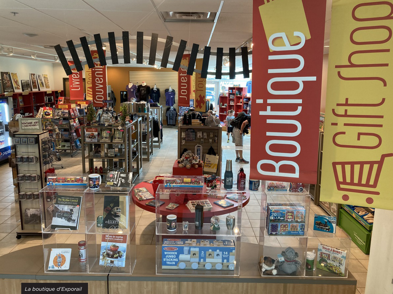
La boutique d'Exporail