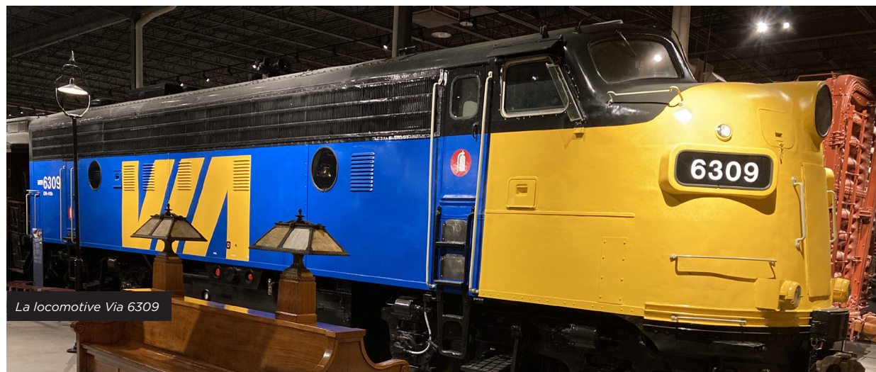
La locomotive Via 6309

Président de la Fondation ACHF et président du comité de Financement de l'ACHF