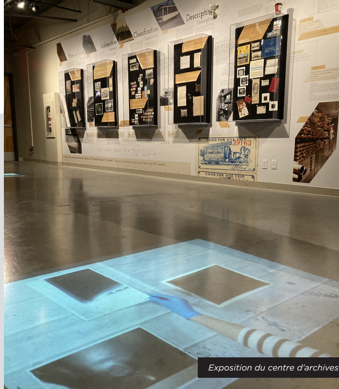
Exposition du centre d'archives

Montant de 30 986,19 $ octroyé par BANQ pour l'exercice 2019-2020;