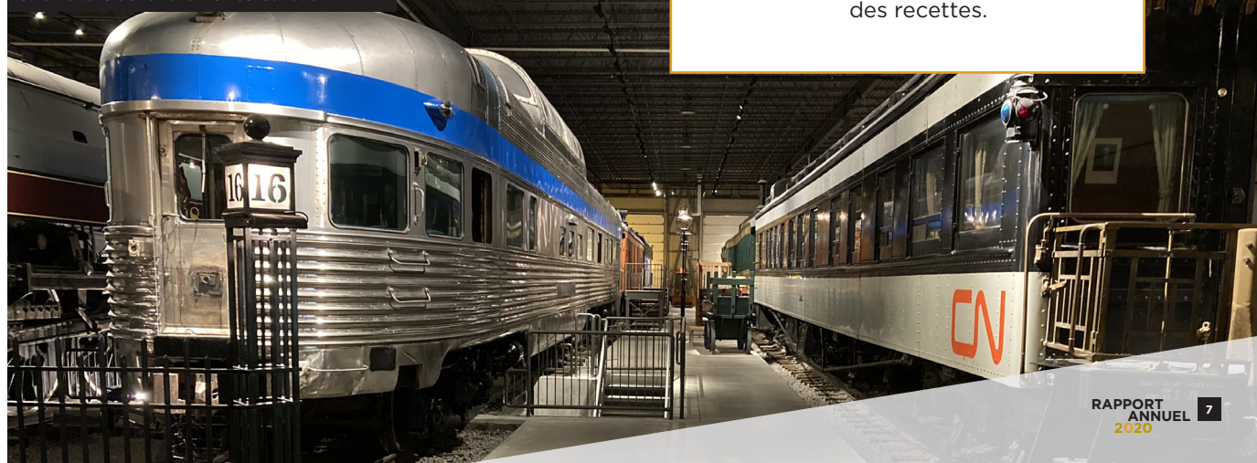
La voiture dôme-observatoire VIA Sibley Park et la voiture de fonction CN63 Canada

Être proactifs face à la diminution des recettes.