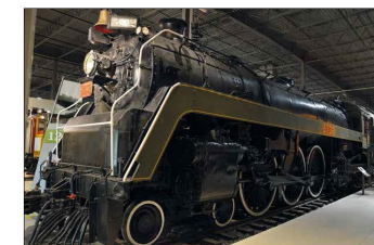
Le 7002, un numéro de passage à l'échelle pour le musée Exporail de Saint-Constant (17 septembre 2019).

D'office pour un Français de bien comprendre comment fonctionne le chemin de fer du Canada. À première vue, le train est un simple véhicule à rouler qu'on pousse. Pour se rendre de Montréal à Québec ou Toronto, nous voyons les wagons qui font le trajet en 3 et 4 heures. La meilleure solution est même l'avion, qui malgré des tarifs élevés est souvent plus efficace. Pourtant, il n'y a que 200 km de Montréal à Québec et 645 km jusqu'à Toronto. Vu de France, c'est la distance idéale pour le train. Pourtant, c'est parce que le train est beaucoup plus sûr que l'avion, qu'il est moins cher et qu'il est plus écologique. C'est d'ailleurs tout étonnant que le pays ait favorisé de toutes parts le voyage aérien et que le train d'une manière générale se porte mal. Bien sûr, ça n'a rien de nouveau. C'est un peu comme quand on a pas le temps de chercher pour tomber sur une entreprise française vendant des produits par un intermédiaire connu de marchandises. Dans ce cas, comme pour l'industrie aéronautique, les trains de voyageurs sont souvent délaissés au profit des avions. Les voies ferrées sont nombreuses et la voie canadienne générale est la plus longue. Montréal, un plan de développement de TDF dans le grand Montréal sur le corridor Québec - Montréal -