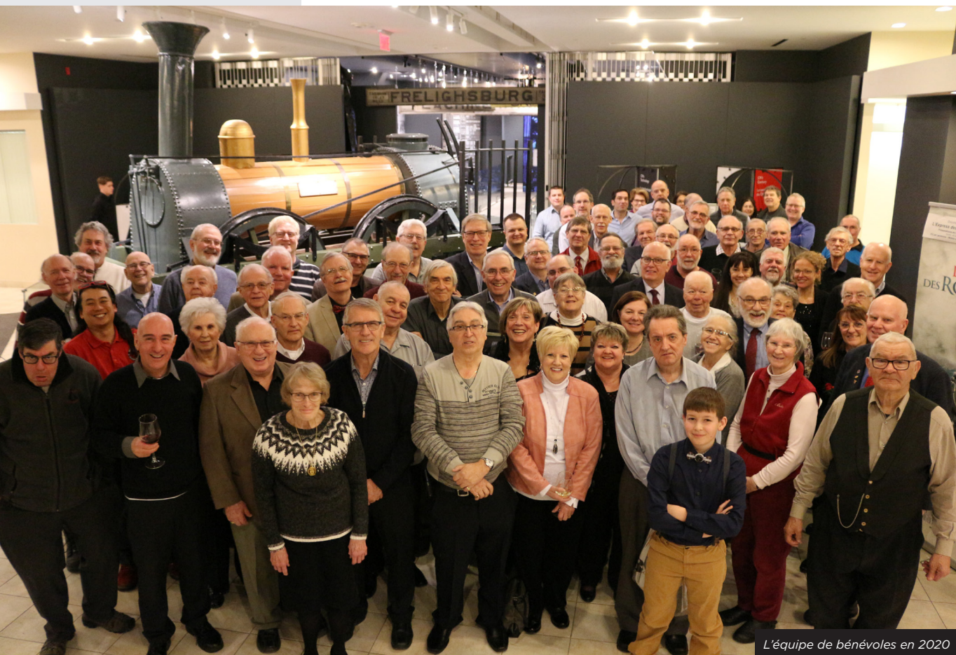
L'équipe de bénévoles en 2020

Les bénévoles comptent parmi l'un des 6 facteurs critiques de succès de la planification stratégique triennale 2018-2021. Pour atteindre nos objectifs, un groupe de travail a été formé avec des bénévoles afin de mettre en place une stratégie de recrutement et pour élaborer des outils de gestion.