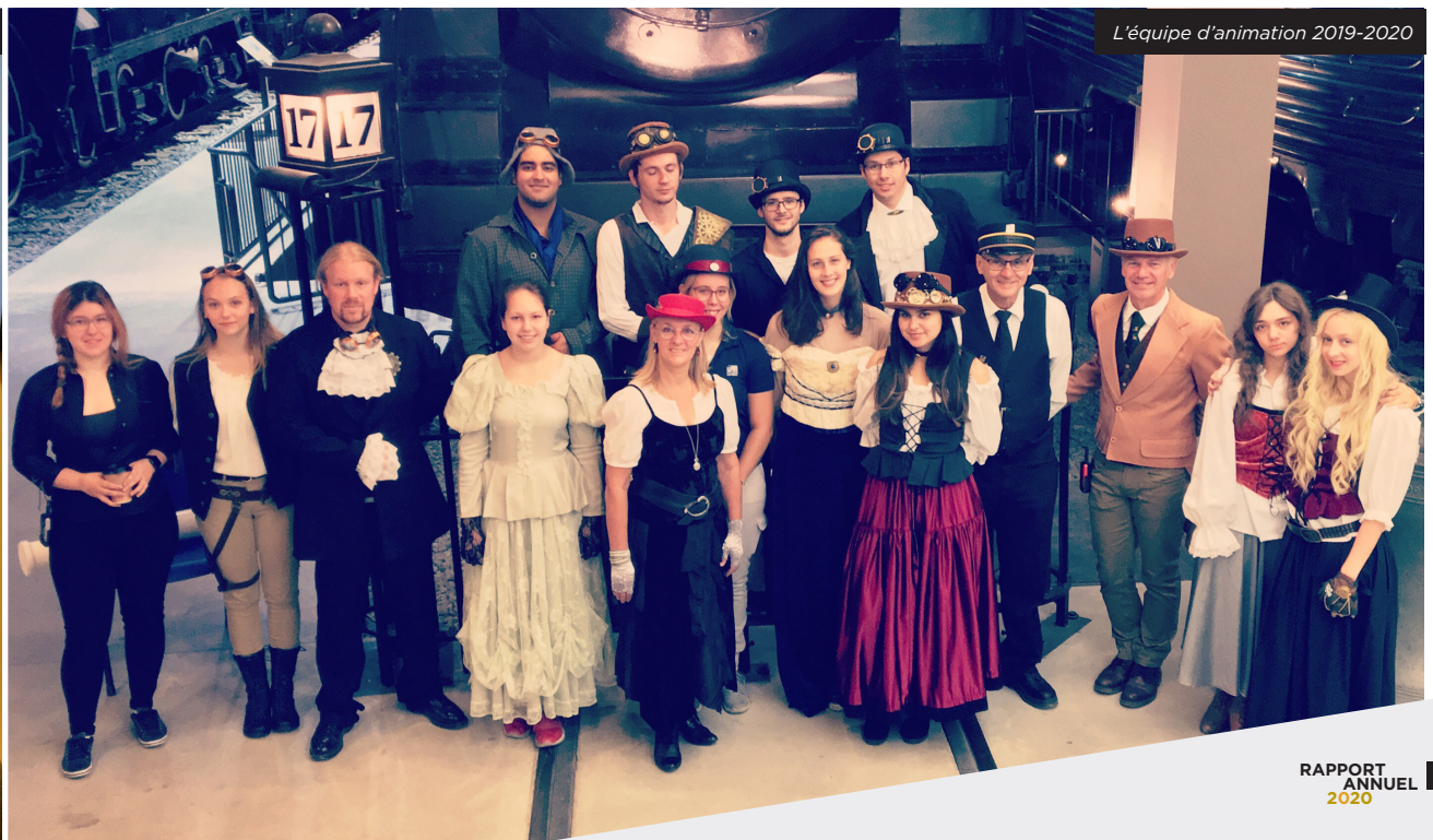
L'équipe d'animation 2019-2020