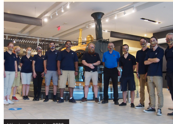
L'équipe d'animation 2020