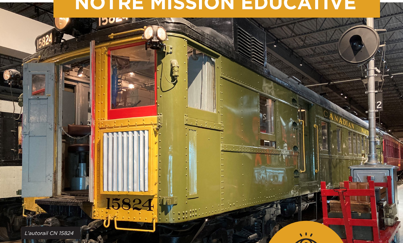
L'autorail CN 15824