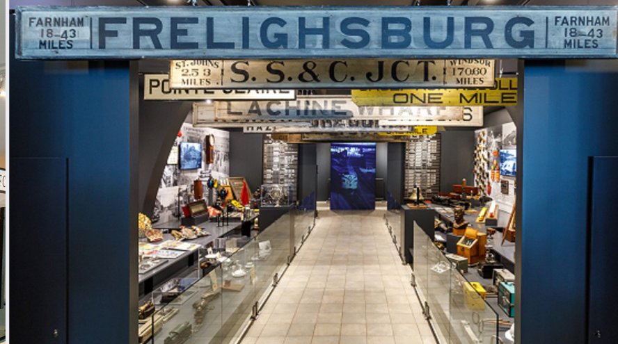
Le hall d'accueil et le couloir d'artefacts